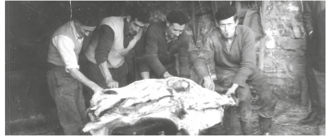
Vecinos de Murua, un día de matanza.

Durante mucho tiempo, los pueblos de Zigoitia fueron los principales proveedores de helechos del matadero de Vitoria. Y a principios del siglo pasado ocurrió una anécdota curiosa.