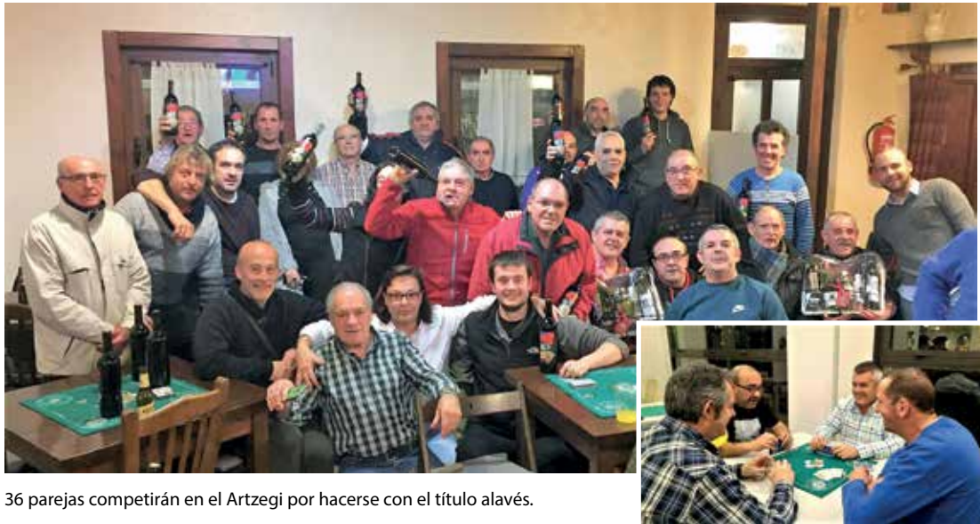
36 parejas competirán en el Artzegi por hacerse con el título alavés.

El 24 de febrero Zigoitia acoge, por primera vez, el Campeonato de Mus de Álava