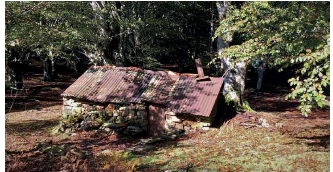
Zizkiño antes de la rehabilitación.