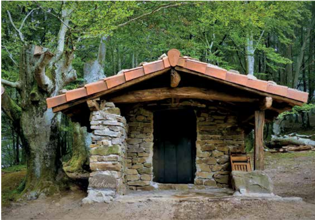
Chabola de Zizkiño después de la rehabilitación.

Textos y fotos: Abadelaueta Elkarte Etnografikoa .