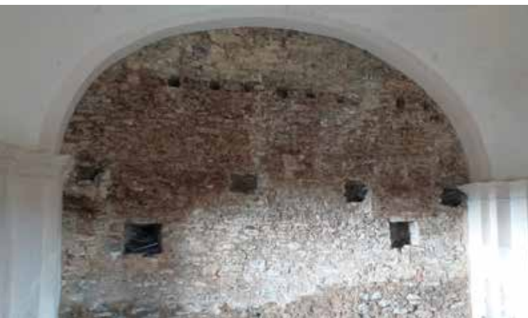
⊕ Mechinales y huecos detectados en el interior.