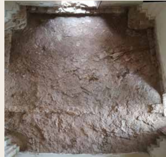
🕒 Estado final del interior al acabar la excavación.